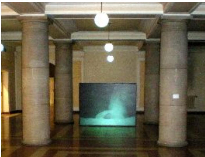
"The White Digger" at the "Best Off 08" exhibition, University of Art and Design Linz, Linz, October 2008

A face on a bed of flour starts to dig itself into the pile. By repeatedly blowing the flour is moved to the side and goes up like a fountain. The flour covers the head and the back and turns into an abstract entity. The flour as a cultural asset and the existential process of breathing combine to create a homogeneous cyclic process.