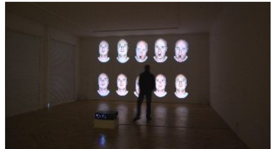
"THIS IS MY VOICE" at the O.K. Centre for Contemporary Art, Linz, October 2010