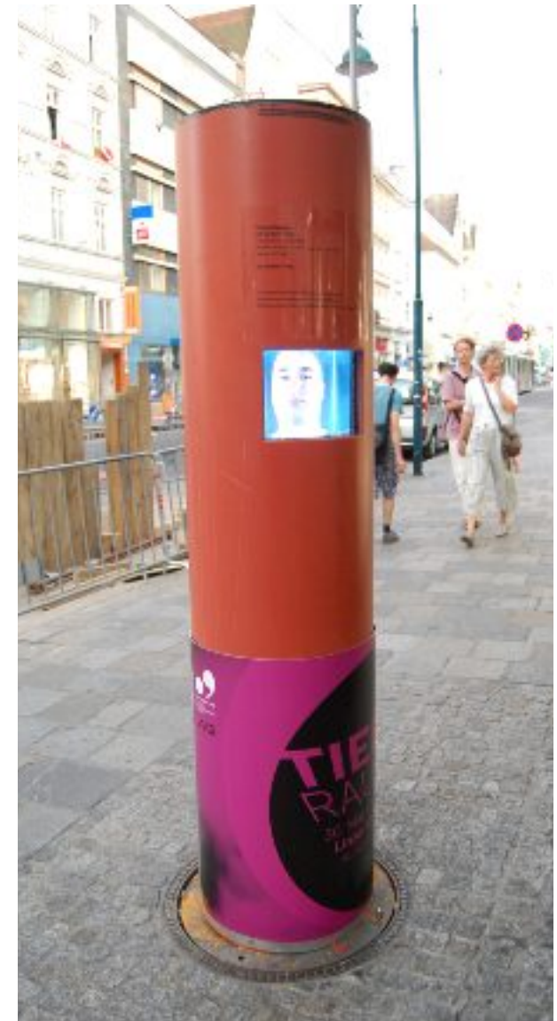
"Ich bin kein Fisch" at the "Tiefenrausch"-exhibition, O.K. Centre of Contemporary Art, Linz, Austria, June 2008