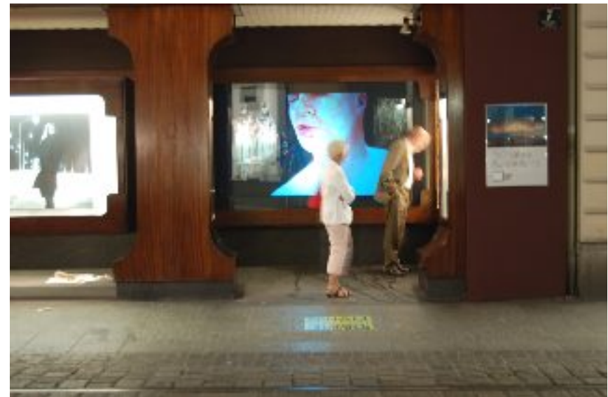
Installationview: „Schaurausch“, Linz, May 2007